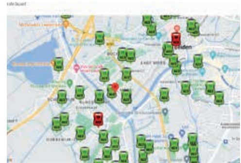
overzicht AED in Morsdistrict Leiden